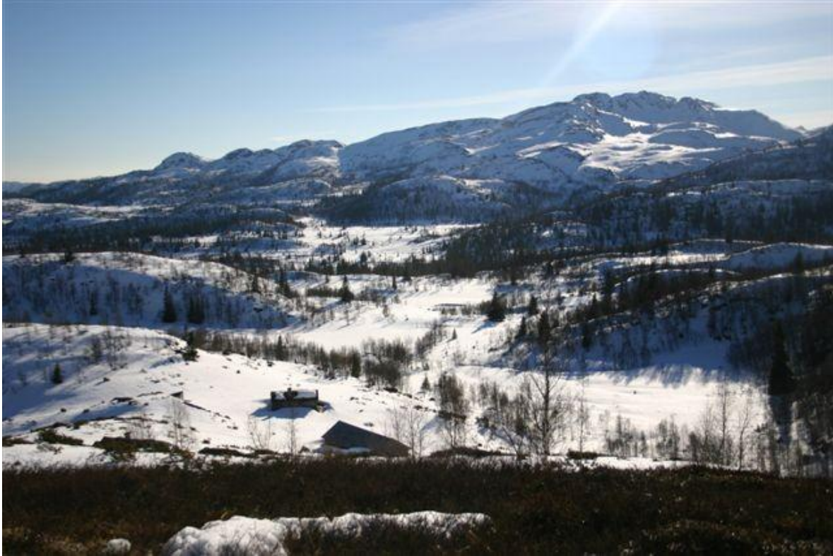
Bilete syner bygningar ved Smørbrekk i Brattefjell-Vindeggen med utsikt mot Gryvlun.