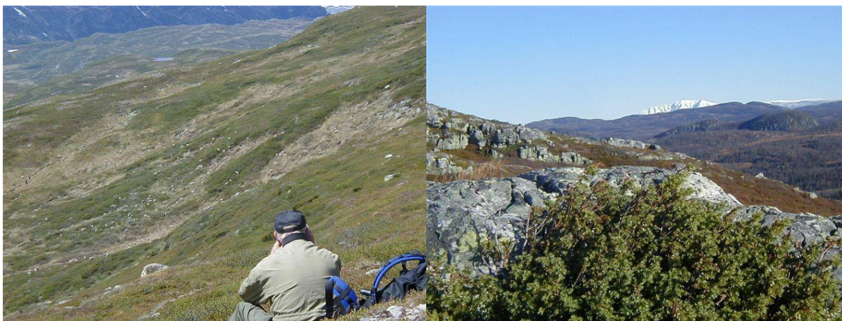
Bilete til venstre syner kalveteling i Brattefjell-Vindeggen. Bilete til høyre syner Gaustatoppen sett frå Grylun.